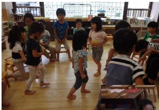
「バナナミルクゲーム」