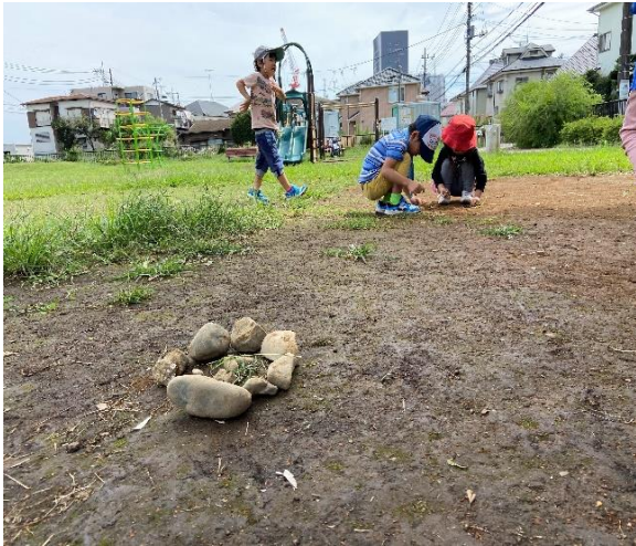
こちらは、たき火のための葉っぱ。