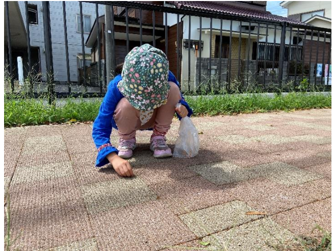
キンモクセイのお花。