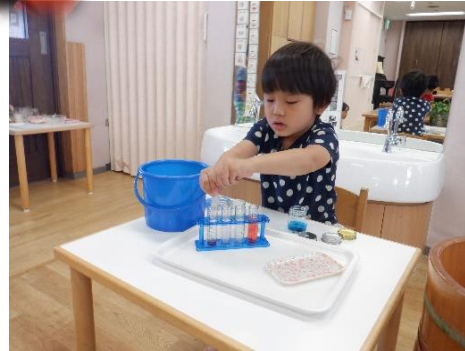
好きなこと、興味あることにじっくり繰り返し取り組む姿も。