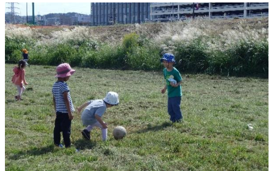
草刈りされた後だったからでしょうか。虫が元気に跳び回っている様子がよく見られましたよ。