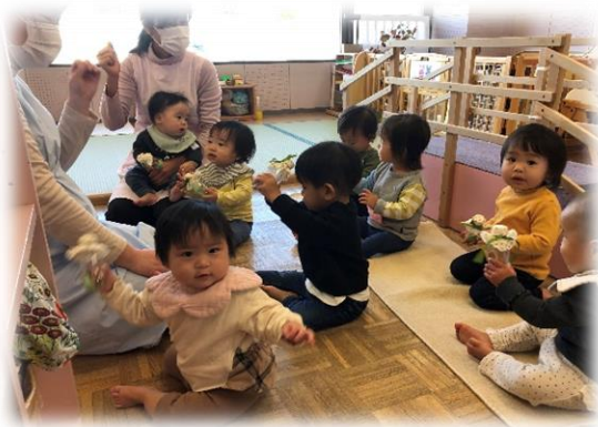
手作り楽器を使いながら遊びました。