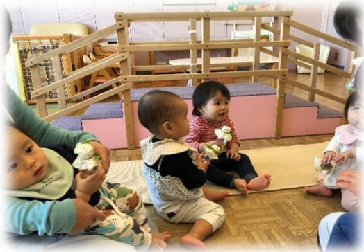
振ったり 叩いたり...