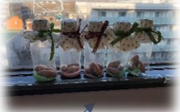
マラカス (どんぐりと色砂)