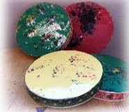
タンバリン (どんぐりと鈴が 入っています)