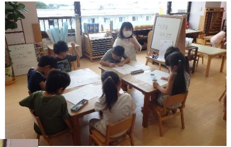
↑ 9月のカレンダーを見て敬老の日に気付く人も。

この夏、おじいちゃん、おばあちゃんに会いに行った人がたくさんいたようですね。「会えて嬉しかった！」という、こどもたちの声から“敬老の日”の話をしてみました。知っている人が多かったようで「ありがとうって言いたい!」「プレゼントも渡したいなあ」と、普段の感謝をどんな風に伝えようか、今から考えている人も既にいるようですね。