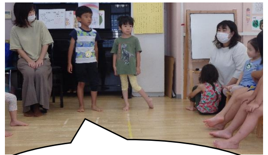
「そうじのとき、食べこぼしが多くて困っています。」

今日は過ごしやすい天候だったため、久しぶりにお散歩に行きました。リビングで夏野菜を収穫した後、多摩川に行きましたよ。