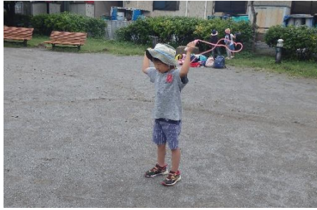
縄を後ろへ..."マント"

一人用の縄跳びをしたいという声があがっていたので、跳び方をみんなで確認してから公園にでかけました。