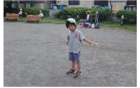
縄を前へ..."エプロン"