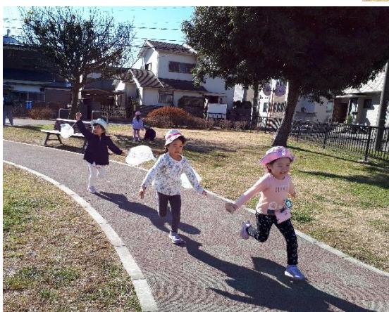
風が強くて、凧揚げ日和でした！！