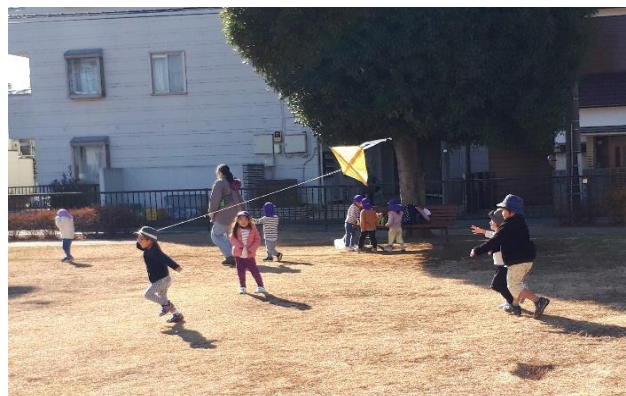
今日は大きな凧も持って、お散歩へ。