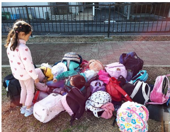
←このリュック置き場には、実は5人の赤バッチさんが隠れています。見つけられますか？