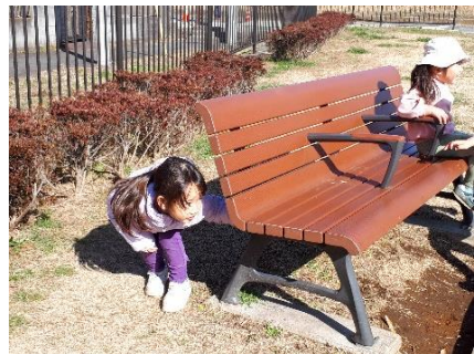
←木の茂みに隠れているのは、だれでしょう？