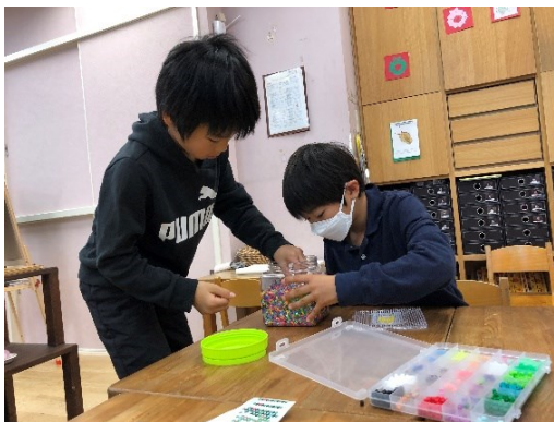
クリスマスの図案でアイロンビーズ