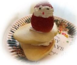
↑かわいらしい サンタさん