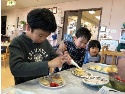
ホットケーキにクリームといちごで デコレーション。