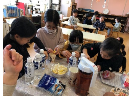
飲み物は、レモンを絞って炭酸を入れて レモンスカッシュに。