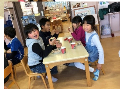
『メリークリスマス!』とともに乾杯。会話も弾んで、楽しいパーティーになりました。