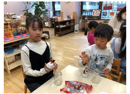
好きな瓶と飾りを選んで、雪を入れました。