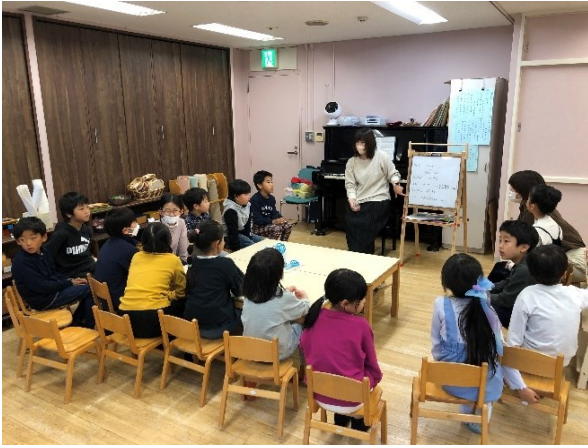
空き瓶でスノードーム作り。